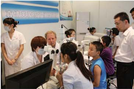
美国眼科专家正在麦迪格中心为患者亲自检测、验配