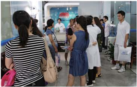
众多学生在麦迪格中心排队体验“非手术7天摘掉近视镜”