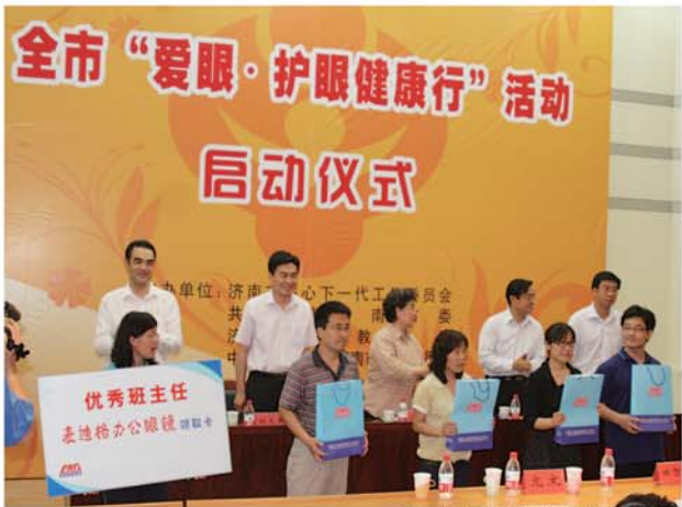
麦迪格向学生捐赠护眼眼产品