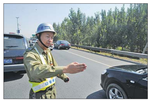
指挥事故车辆尽快让出车道。