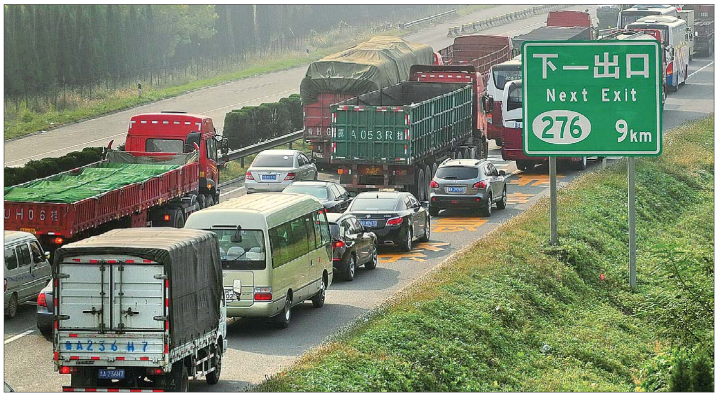
9月30日，老济青高速上，很多车辆在应急车道上通行。