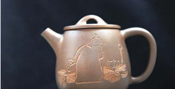
图为刘光紫砂刻绘作品