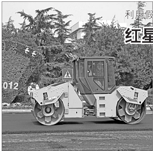
红星路中段翻新改造,郭刚 摄

7日24时高速免费政策截止,8日零时将恢复收费,交警提醒广大车主,因长途行驶尚未到达目的地的车辆切勿超速行驶,如确实无法在10月7日24时前到达目的地,可以采取就近下高速后再上高速的方法,实现免费与缴费的平稳过渡,避免因缴费问题产生纠纷。