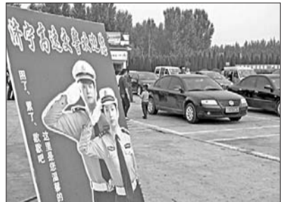
交警部门设立多张警示牌

此次翻新的道路全长1170米,宽24米,记者7日从道路沿线看到,翻修一新的路面非常平整,一改以往坑坑洼洼的旧貌,而隔离带的拆除,也让道路显得更加宽敞,沿线重要路口也重新划好了交通标志线。“选择在国庆期间施工,是因为该段道路两侧以机关单位居多,放假后道路上车流量会有所减少。”该负责人称,为了方便车辆通行,施工时采用了分段封闭的方式进行。