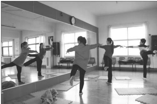
考生正在德州某培训机构备战舞蹈考试(资料片)。

北京大学2013年“中学校长实名推荐制”推荐资质申请工作日前已经结束。2013年自主招生的序幕已经拉开。