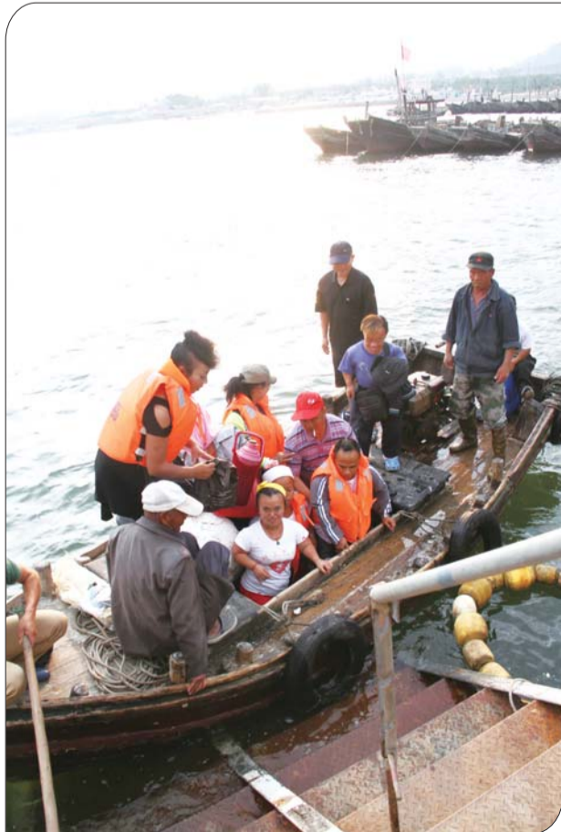
傍晚时分,小精灵艺术团表演完乘船下岛。