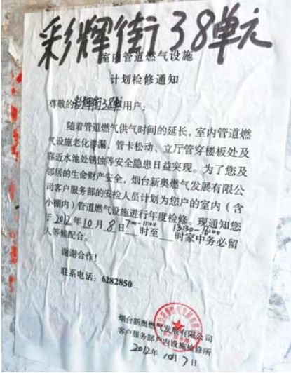
近期发生的多起燃气爆炸事故引起市民关注,港城燃气公司开始对燃气管道设施进行检修。

“已经改了,现在心情很忐忑。”家住四马路附近的刘先生称,他新买了一套房子,上个月找人私自改了燃气管道,“不漏气就好,我怕万一漏了气,真不知道该如何是好”。他还担心,燃气公司的人上门检测,发现私自改动后不给通气。