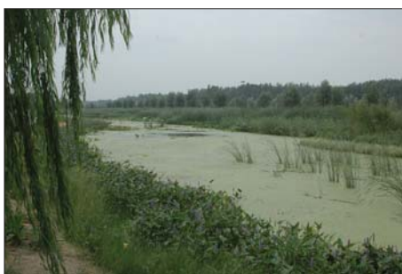
小湄河人工湿地。