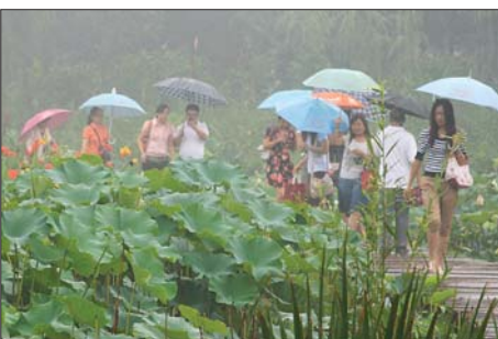
赵王河植物园。