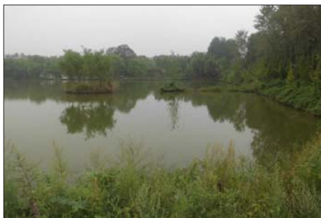
九州洼湿地。