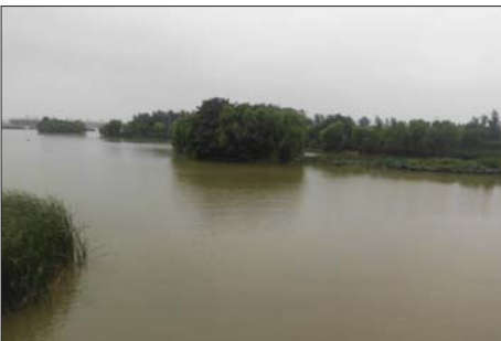
城区南部的湿地岛。

该加强宣传,提高市民的生态环保意识。”王振健说,现在聊城正在实施“大水城战略”,贯通三河一湖,水系与乡村结合,形成大水城概念。这对聊城湿地来说是个好消息。“在这一建设过程中,市民生态环保意识的提高,对于‘大水城’建设至关重要。”