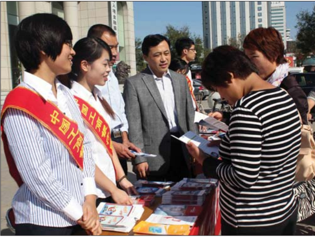
中国工商银行聊城分行古城支行的工作人员正在向市民普及金融知识。