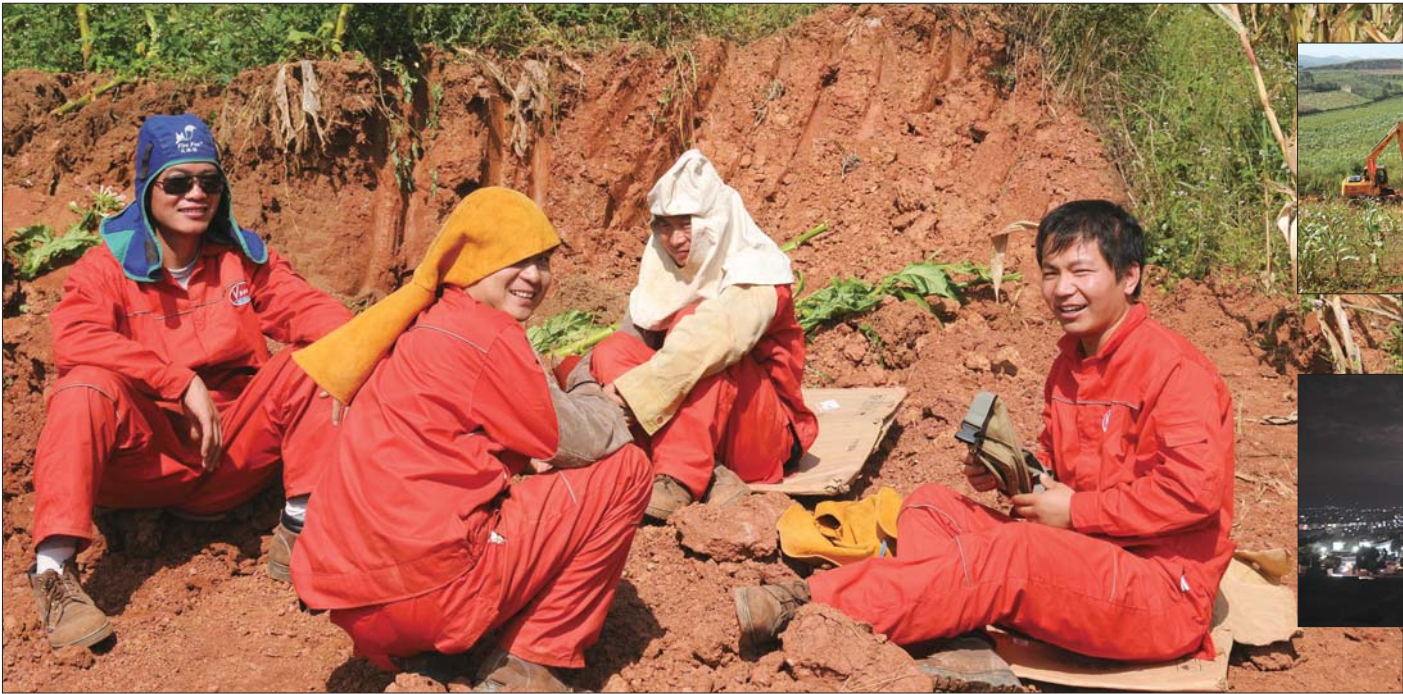
施工人员短暂休息。