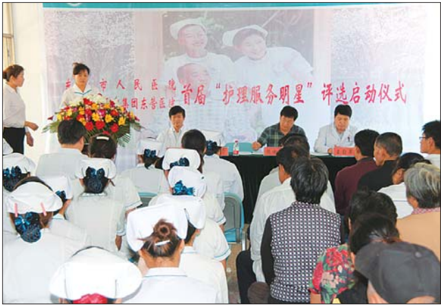
市人民医院首届“护理服务明星”在肿瘤科病房启动。