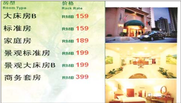
市区一家酒店的住宿价格。

连锁型商务酒店是游客出行选择较多的酒店类型,双节期间,日照的连锁酒店的住宿价格,也随着旅游的升温而水涨船高。 据了解,位于日照火车站附近的锦江之星海滨五路店,以标准间B为例,该房型配有1.35米大床和1.1米小床,黄金周期间