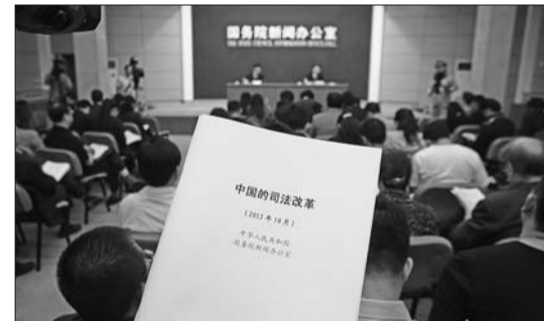
6日,《中国的司法改革》白皮书发布现场。

法院只收取案件受理费、申请费。大幅调整财产、离婚、劳动争议等与人民群众密切相关案件的收费起点和比例,标准,实际收费大大减少。在减免诉讼费用方面,当事人交纳诉讼费确有困难的,可以向人民法院申请司法救助,并明确了免交、减交、缓交诉讼费用的情形、程序和比例。