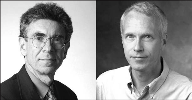
罗伯特·莱夫科维茨(左)和布赖恩·科比尔卡。

据新华社斯德哥尔摩10月10日电 美国科学家罗伯特·莱夫科维茨和布赖恩·科比尔卡分享2012年诺贝尔化学奖,以表彰他们在“G蛋白偶联受体”方面的研究。 瑞典皇家科学院常任秘书诺尔马克说,人的身体是由数十亿细胞相互作用的微调系统,每个细胞都包含能感知周围环境的微小受体,因此才能适应新的环境。两位获奖者的突破性研究揭示了受体中最大家族“G蛋白偶联受体”的内部运作机制。 20世纪80年代,该领域研究又有了跨越式发展,科比尔卡通过巧妙的实验方法将β肾上腺素受