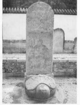
杜仁杰撰《张山洞虚观记》碑文