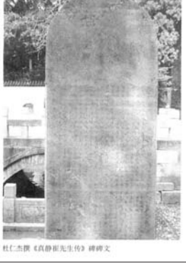
杜仁杰撰《真静崔先生传》碑文