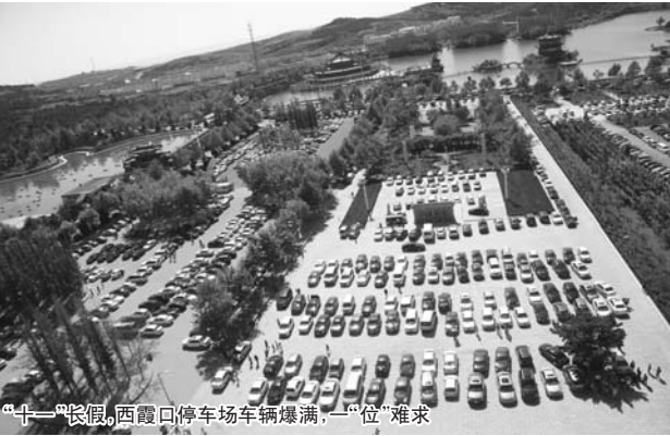
“十一”长假，西霞口停车场车辆爆满，“一位”难求

“十一”黄金周，我国首次实行高速免费通行政策，加上近年来私家车增多，自驾游客大增，占据了景区游客总量的“半壁江山”。 “今年，景区自驾车量同比增长了30%。”济南九如山瀑布群负责人告诉记者，“长假期间，自驾游客全国分布，尤其是以山东为半径辐射700里以内的地区游客数量最多，其中，像江苏、辽宁、内蒙古、陕西、四川牌照的自驾车甚至呈小团体态势，家庭游是主力。”记者10月1日在金象山乐园大门口看到，私家车往来不断，四个停车场全部爆满，1500多个车位无一闲置；济南九顶塔中华民俗欢乐园也是如此，由于景区开放夜场演出，晚上仍有许多车辆入园，工作人员不得不15个小时不间断指挥车辆进出，十一期间更是新增加了1000多个车位来满足自驾游客的需求。 在蒙山云蒙景区(蒙阴蒙山国家森林公园)，十一期间自驾游游客大增，全国各地的私家车纷纷涌入，游客量突破20万人，旅游综合收入近2000万元；在蒙山龟蒙景区，来自省内和江苏、河北等地的私家车停满了景区停车场及周边道路，成为一道靓丽的风景线；在威海西霞口景区，自驾游客成为了整个长假的“主角”，景区在节前新添了多个停车场，3000多个停车位充分保证自驾车辆的停放；在山东龙冈旅游集团旗下的山东地下大峡谷景区，自驾游散客占到景区游客总数的80%，山西、上海、浙江及其他省市的散客人数都有大幅度增加，散客辐射区域广成为一大特色；在港中旅(青岛)海泉湾度假区，国庆期间可容纳2000辆车的停车场停满了私家车，其中不乏来自北京、江苏、内蒙古等地的车牌，韩国客人也是络绎不绝。 近年来，随着人们旅游渐趋理性，更加注重旅游的品质，许多游客摒弃一天跑好几个景区式的“走马观花”，而