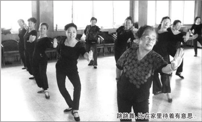
跳跳舞,比在家里待着有意思。