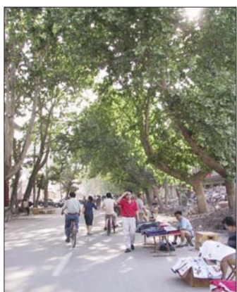
2001年5月28日，拓宽改造前的泉城路。