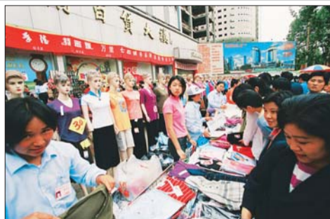
大甩卖。2011年，泉城路拆迁前商家