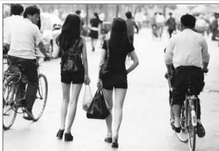
城时尚潮流。 1998年，泉城路已经引领省