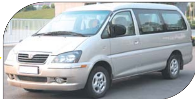
◀菱智M5 2.0L 舒适版