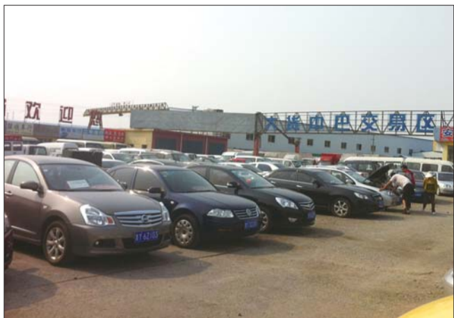
幸福南路一家二手车交易市场内看车市民很少。

一直以来,二手车以较低的价格,吸引不少消费者购买。但随着今年新车不断推出促销政策,二手车的利润及生存空间受到压缩,截至今年9月底,烟台旧车交易量比去年同期下降近三分之一。