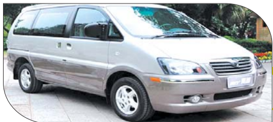
◀菱智V5 2.0L 9座