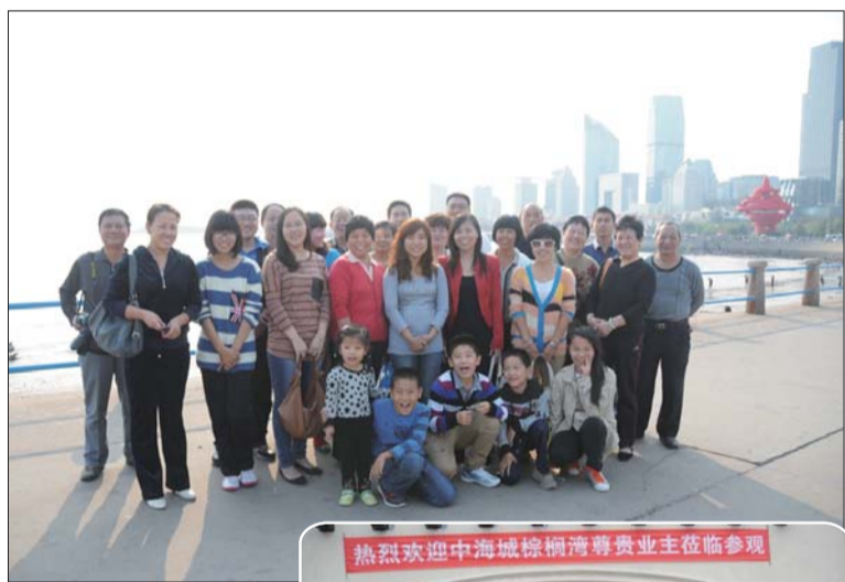
▲中海城·棕榈湾业主在青岛游玩时合影留念。