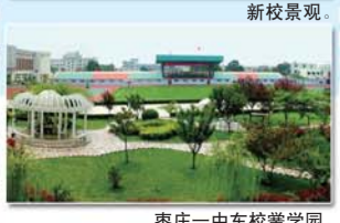
枣庄一中东校黄学园。