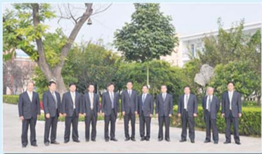
团结奋进的领导班子。

承水滔滔,坛山青翠,榴花飘香,见证了枣庄一中的六十载栉风沐雨、铸就辉煌的办学历程。从1952到2012,走过60个春秋的枣庄市第一中学,她没有耀眼的高楼,但60多年的办学历史见证了一中人的奋斗与拼搏;她没有最先进教学设施,但一中人却有着那颗积极向上的进取心;她没有令人骄傲的光环,但一中人有着对事业的执著追求和坚定的信心。因为枣庄一中发展历程孕育和传承着“严谨求实、团结奋进”的优良校风,坚持和实践着“多元育人”的办学理念,所以,枣庄一中,就像一坛老酒,历久弥香,在一中人的心里,她永远青山不老,风采依旧。