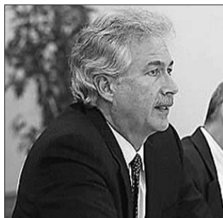
美国副国务卿伯恩斯 (资料片)

据中新社10月16日电 美国常务副国务卿伯恩斯将于今明两天访华,双方将就中美关系和共同关心的国际地区问题交换意见。据日本媒体报道,伯恩斯昨天对安倍晋三表示,希望日本不要再让事态升级。