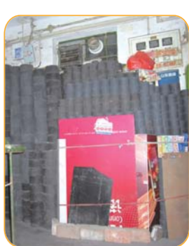
一老小区楼道内堆了许多蜂窝煤。

像历园新村这样的小区不少,传统的土暖随处可见。不少市民表示,烧土暖气美中不足的是换蜂窝煤费事,不卫生,而且比较危险,总得提防一氧化碳中毒。对于集中供暖,他们更加期待。