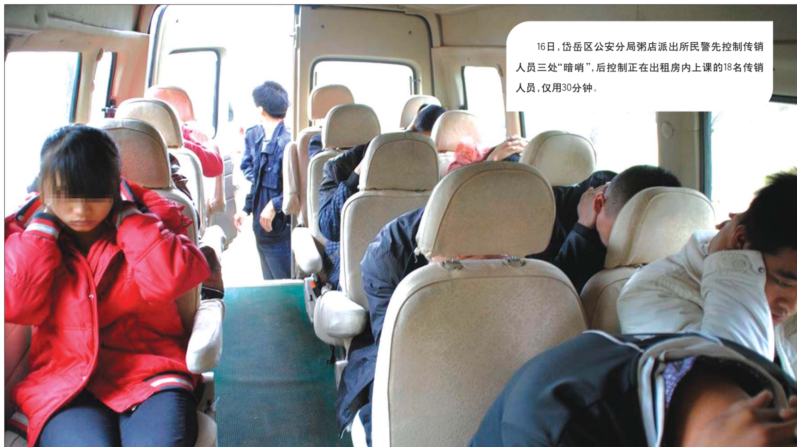
16日,岱岳区公安分局粥店派出所民警先控制传销人员三处“暗哨”,后控制正在出租房内上课的18名传销人员,仅用30分钟。