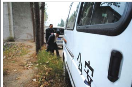
民警带回传销分子。