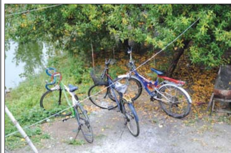
传销骨干才有自行车。