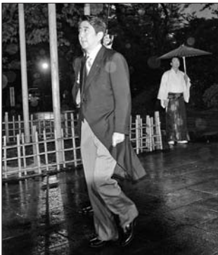
17日,日本自民党总裁安倍晋三参拜位于东京的靖国神社。

一阶层人士的支持,为他最终重返首相官邸奠定基础。 言其短视,是因为“拜鬼”之举只会让日本在历史认识的怪圈中越陷越深,也在周边外交的困境中越陷越深。 言其懦弱,是因为历史已经反复证明,做错事并且将错就错并不需要太多勇气,真正需要勇气的是正视真相,纠正错误。 日本之否定侵略历史,最具体最集中的象征就是靖国神社。对日本政治家来说,参拜与否是其在历史认识问题上的试金石。安倍今日“拜鬼”之易,给世人的警示是:日本要想真正走出侵略历史的“魔影”,难!