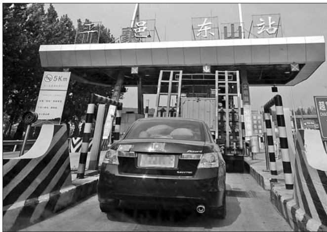
高速公路上,一日系车主将标识遮挡起来。(资料片) 本报记者 左庆 摄

航班加起来才凑了50个人,此前一个航班就得200多人。”上述负责人表示。 记者发现,为了吸引旅客,济青飞日本的航线机票价格均大幅跳水。济南至大阪由之前的约2500元降至1500元,全日空航空在青岛至大阪航线推出了650元的特价机票,较正常票价优惠1200元左右。