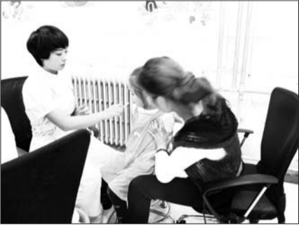
许多儿童开始接种流感疫苗。

介绍,流感疫苗优先接种8类人群:5岁及以下儿童,尤其是2岁及以下的婴儿;60岁及以上老年人;心血管疾病(高血压除外)、慢性呼吸系统疾病、肝肾功能不全、血液病、神经系统疾病、神经肌肉功能障碍、代谢病等慢性病患者;患有免疫抑制疾病或免疫功能低下的成人和儿童;18岁以下青少年中长期接受阿司匹林治疗者;长期居住在养老院和其他慢性病康复机构的人员;准备在流感季节怀孕的妇女;重度肥胖者;有较大机会将流感病毒传染给高危人群的人员;养老院和其他慢性病康复机构的工作人员;5岁及以下儿童、60岁及以上老年人、其他流感高危人员的家庭成员及照看、护理他们的人员,特别是照看6月龄以下婴儿的人员;医疗卫生保健人员。