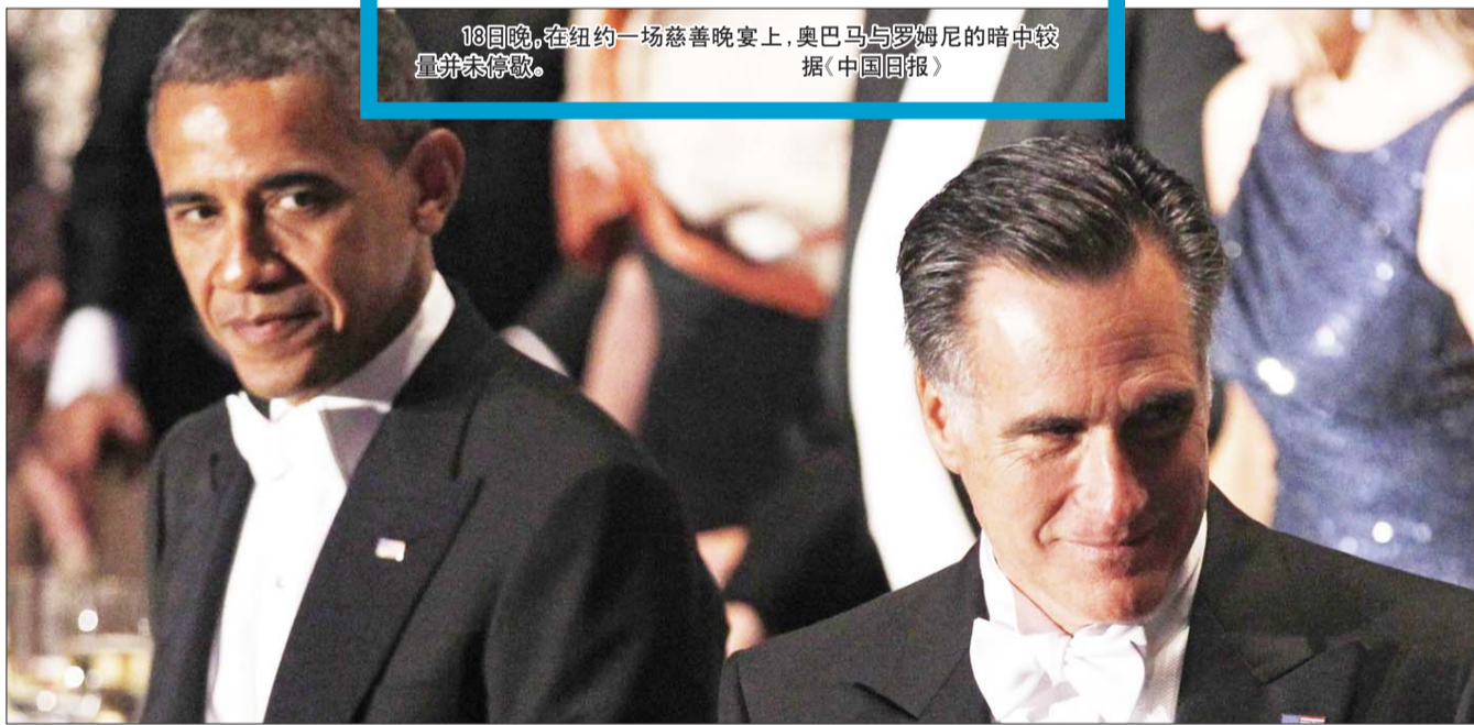
18日晚,在纽约一场慈善晚宴上,奥巴马与罗姆尼的暗中较量并未停歇。 据《中国日报》