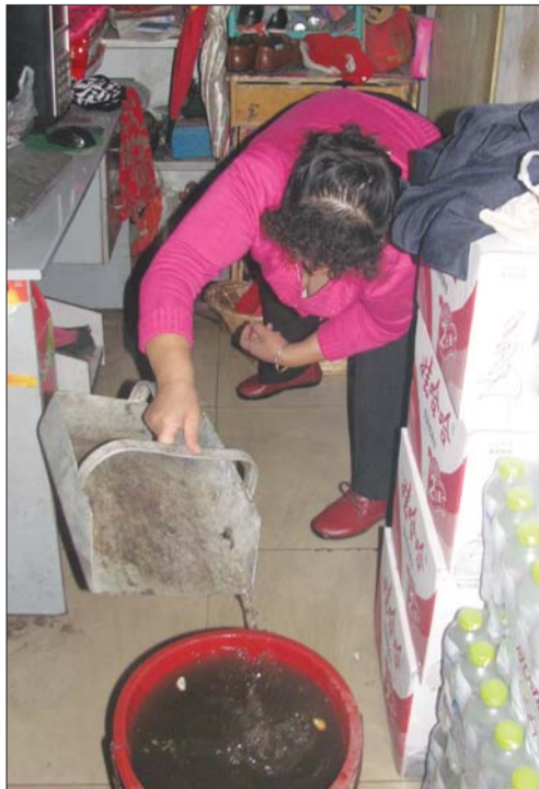
◀王女士忙着把积水清理到桶内。

工作人员介绍目前漏水原因还没法确定,要找到当时的施工人员询问情况,以确定是否施工存在问题。