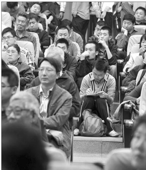
报告厅里坐满了听众。