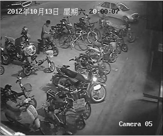
张某将车骑走,但一切已被监控录了下来。(视频截图)

“我骑着车子就在附近找了好几家废品收购站,刚开始他们不肯要。”就这样,张某骑着车子在附近寻找买家。“有个收购站说怕车是偷的,我就说家里买车了,