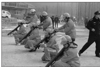
使用肩扛式灭火炮演练。(资料片)