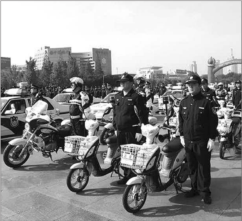
在全省公安机关社会面安保巡防机制启动仪式上,上百警用车在泉城广场整装待发。

届时,济南市街面巡防力量将达到4100余人,每天160辆巡逻警车24小时巡防街面,严密对学校、广场、商场、繁华商业街区、公园、火车站、汽车站等重点要害部位、区域和治安复杂地区周边以及夜间重点时段的巡防守候,加大对城区主干道、部分次干道的巡控力度。