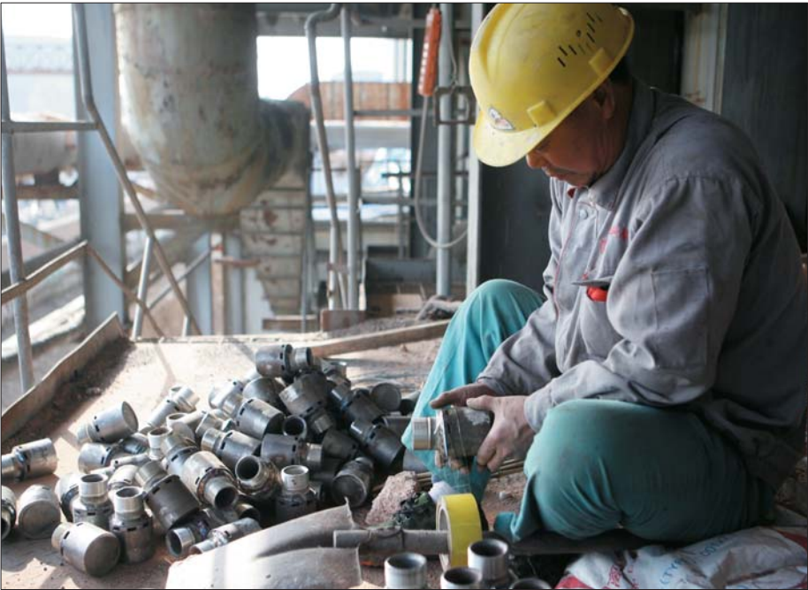
即将安装到锅炉内部的风帽。

本报10月22日讯(记者 董惠)在较强冷空气的影响下,近日潍坊市气温骤降4至6℃。22日,记者采访了解到,市政府提前召开冬季供热专题会议,部署冬季供热工作。供热企业将提前7天开始低温试运行,确保市民过“暖冬”。 按正常情况,每年11月15日至次年的3月15日都是潍坊法定供暖时间。在每年供暖季开始前,热企都会提早对供暖设备进行检修、维护。22日,记者来到位于潍州路的潍坊昌能热源有限公司,不同岗位的工作人员都在热火朝天地做着最后的准备。“到10月底之前,我们必须完成设备的检修工作,”在锅炉检修车间,潍坊昌能热源有限公司的副经理任海强告诉记者,热源厂的各项准备工作从9月份就已经正式开始了,热源厂制定了详细的工作计划。“现在很多工作人员都是加班加点的干,设备检修也都在收尾了”。 走进热源厂6号锅炉检修现场,5名工作人员分别在自己的分工岗位上忙碌着。透过锅炉口,两名工作人员正在炉膛内更换、保养锅炉风帽。“风帽安装在锅炉的炉膛底部,煤炭被送进炉膛后,就得靠风帽吹出的风吹起来,然后成沸腾状燃烧。每年供暖季结束后,很多风帽都会有磨损,需要在下个供暖季到来前,进行保养、更换,”昌能热源锅炉车间副主任朱康龙告诉记者,每个炉膛内风帽得有成百上千个,单单这一项保养就已经花了一个星期的时间了。 22日,记者采访了解到,其实,在上一个采暖期结束后,各供热企业就立即展开了供热设施检修工作,目前已基本完成供热锅炉等大型设备的检修,更换补偿器88个,更换各类阀门300余个,而检修工作将于10月底全部完成。 除此之外,各供热企业采取在小区设立收费点、委托银行代收等多种方式,为用户缴费提供便利,热费收缴工作进展顺利,目前已完成约60%,预计月底将基本结束。