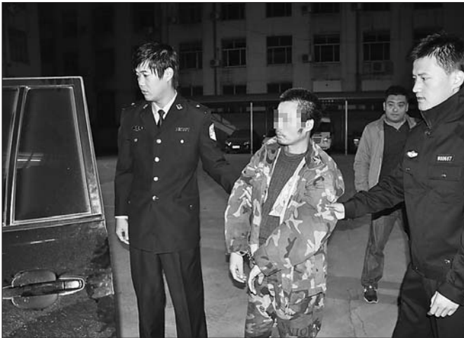
逃亡十年,终于被抓获归案。 本报通讯员 于浩 摄

本报10月22日讯(记者 彭彦伟 通讯员 宋时轮 于浩) 由于看着不顺眼,两伙人之间起了纠纷,冲动之下孙某用猎枪将王某杀害后逃亡。莒县公安局刑警大队先后6次奔赴吉林,将潜逃10年的犯罪嫌疑人抓获。 2002年1月份,莒县棋山镇王某在赶集时看到张某(化名)不顺眼,随即打了对方一巴掌。但没过几天,王某又与王某等人遇到了王某,几个人又将王某打了一顿。感觉吃亏的王某多次纠结村里人到王某所在的村打架。 2月14日,王某再次纠结村里亲朋好友到王某所在的村打架,随即两伙人打在一起,在打架中犯罪嫌疑人孙某被打后心里感觉窝火,随即孙某回家拿出猎枪对着王某开了一枪后就逃亡了,结果王某被枪击身亡。 案发后,孙某被列为网上逃犯,莒县公安局一直对其跟踪布控并多次赴东北进行追缉抓捕,但因孙某行踪不定,具有很高的反侦察能力,抓捕一直未果。 民警调查发现,犯罪嫌疑人孙