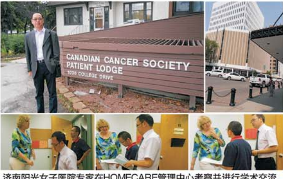
济南阳光女子医院专家在HOMECARE管理中心考察并进行学术交流

飞抵加拿大,踏进温哥华医院,让人处处感觉到医学气息。在温哥华医院腹腔镜在妇科领域的应用很常见,大大提高了微创技术治愈率,避免了大切口手术的弊端。博采众长,为已所用。济南阳光女子医院专家表示,这次学术交流旨在掌握保留(护)器官功能微创手术的经验、技巧、防范手术并发症,了解妇科微创手术的新技术、新方法,规范操作,提升驾驭微创理论与实践的水平和能力。