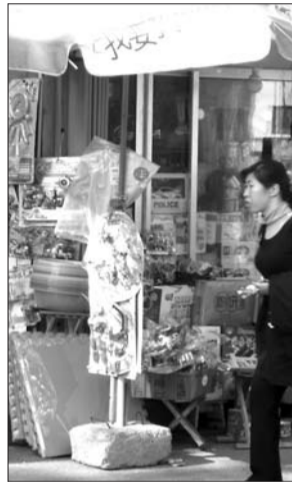
小铺太阳伞多只是用石头压在在地上。