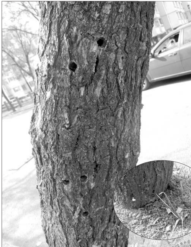
▲一棵槐树上被天牛打了几十个孔,树下野落了一层虫子咬出的木屑。

的行道树已完成涂白工作。园林处工作人员介绍,本次涂白工作涉及市区38条干道,涂白的树木包括国槐、法桐、白杨等,目前大多树木已经完成了涂白工作。