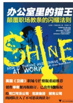
《办公室里的猫王》 克里斯·巴瑞兹布朗 浙江大学出版社

办公桌是你进行工作的有用场所。它的设计目的是提高人的工作效率。它所提供的物理支持能让你富于逻辑思维的大脑如激光般快速而专注地运转。不错,为了能够高效工作,你需要一张办公桌。