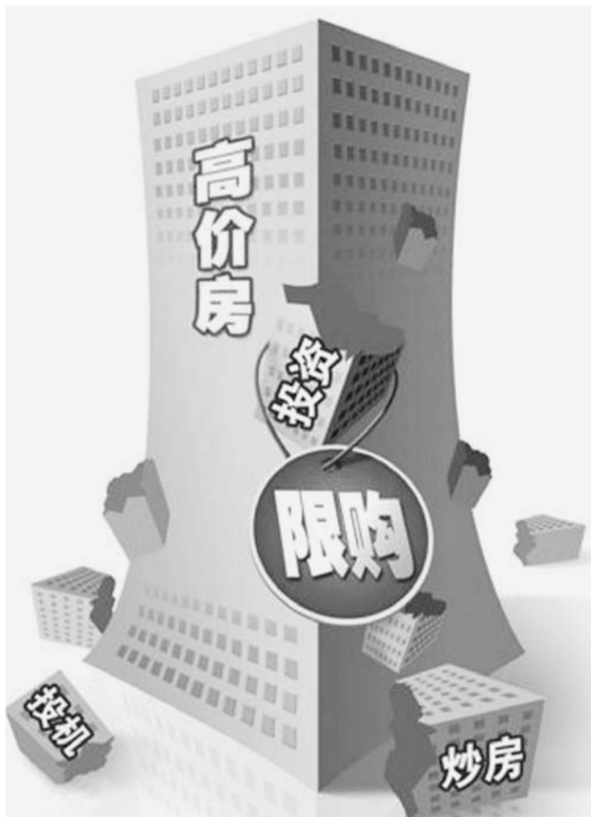
计10月28日加推高层房源;城阳区的润兴新海湾预计月底加推两栋小高层,现已经开始认筹,交2万元,开盘