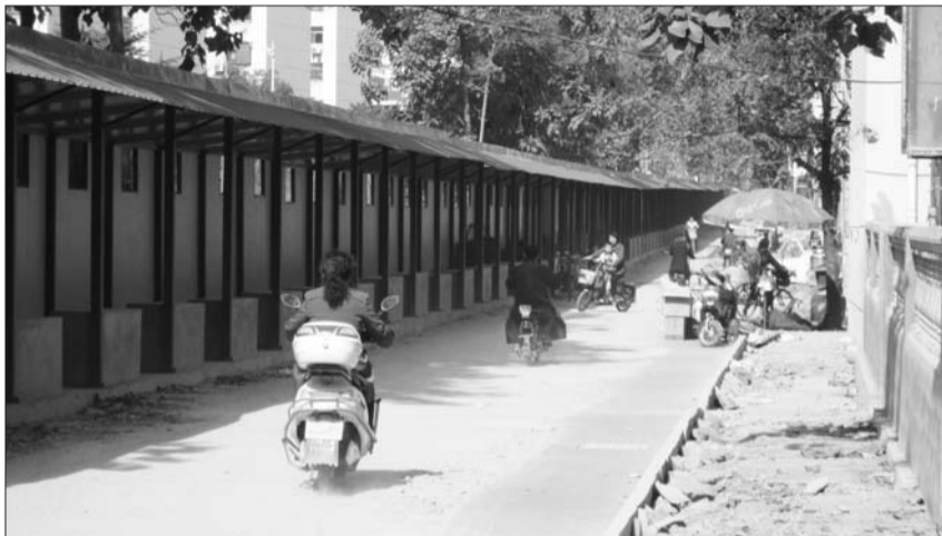
市场冷冷清清没商贩更没顾客。

而在新市场的南头,也有几家商贩在里面营业了。一位商贩告诉记者,据他所知,其实摊位已经预订出去一部分了,但是由于摊位前的路面需要整修,因此商贩还不能入驻,至于何时才能入驻,这位商贩表示不知情。