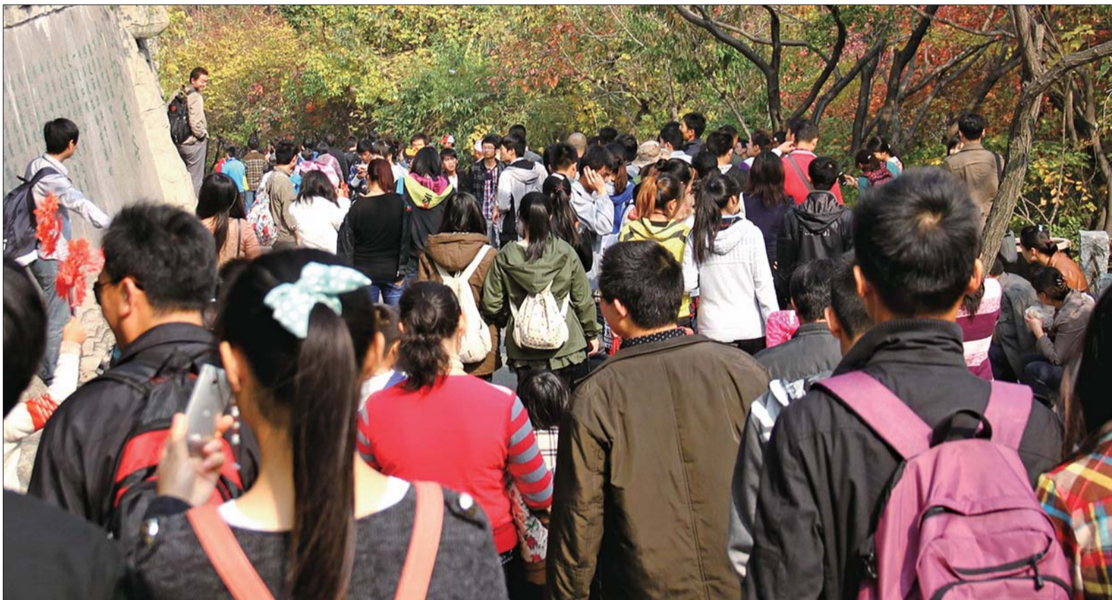
28日,红叶谷景区内游客如潮。当天,大量车辆涌入南部山区,欣赏最后的红叶和柿子树等秋日美景。

北京市已经启动了供热气象会商,全市供热单位已做好11月1日开始供热的准备。那么,济南市是否会提前供热呢?记者获悉,省城虽然尚未实行气象会商,但不少供热企业和换热站等已经做好了提前供热的准备,具备了提前供热的条件,一旦需要,就可开始供热。