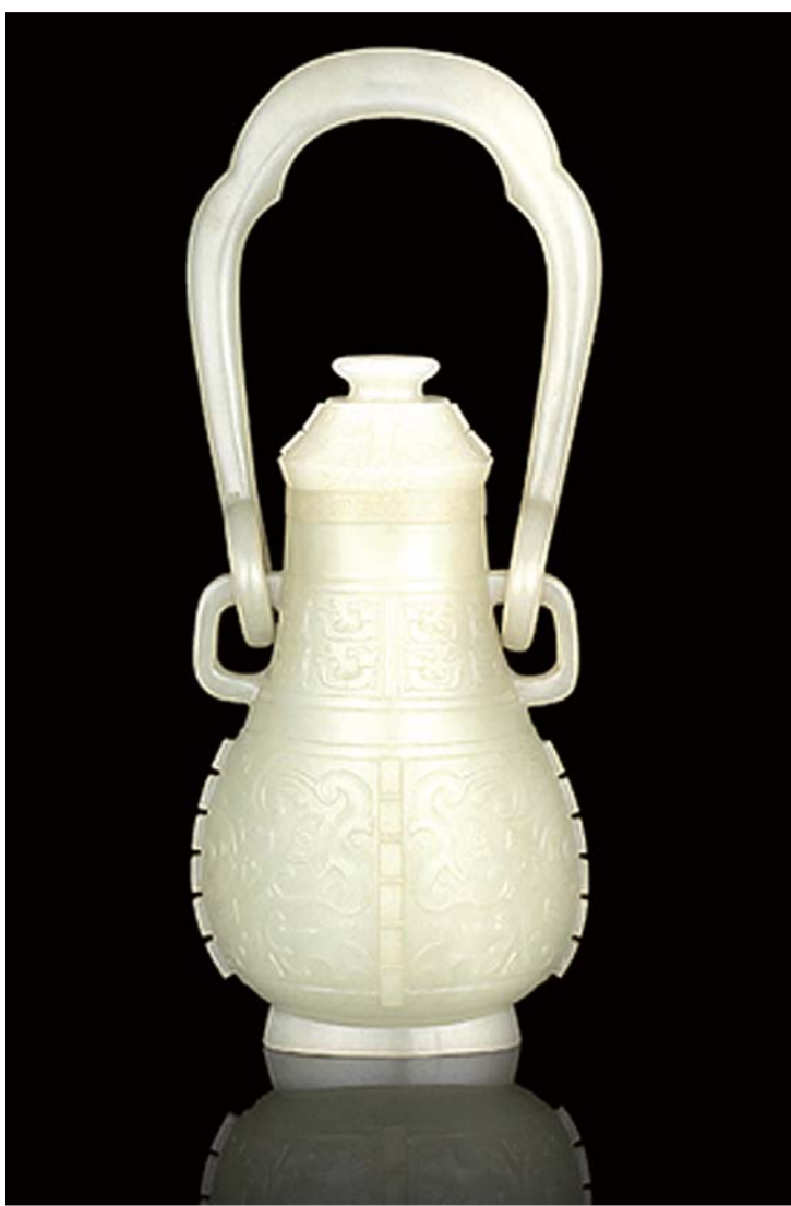
青玉雕仿古兽面纹提梁卮。

同年,法国博桑-勒费福尔拍卖行在巴黎举行的一场名为“亚洲艺术”的专场拍卖会中,“九州清晏”宝玺现身,此玺为白玉质地,交龙钮。宝玺起拍价是30万欧元,最终以138万欧元的落槌价成交。相关资料显示,这方白玉印章制于18世纪清朝乾隆年间,通高9厘米,长、宽各为10.9厘米,底部呈现四方形,刻有“九州清晏之宝”六字,上部呈现双龙造型。“九州清晏”为圆明园最早建筑群之一,亦为“圆明园四十景”之一,坐落于圆明园西部,其名寓意河清海晏,天下升平,江山永固。这方玉印“来自瓦苏瓦涅将军收藏”。1860年英法联军火烧圆明园时,时任上校的瓦苏瓦涅