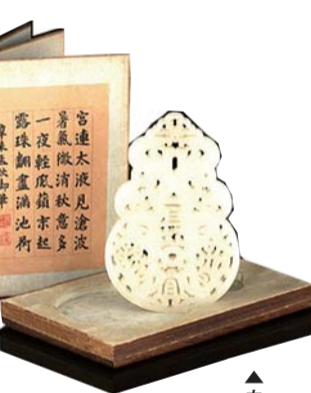
▲白玉镂雕凤纹长宜子孙牌。