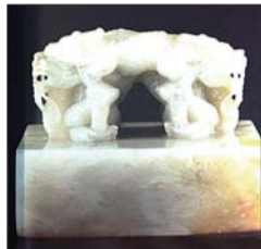
绮春园敷春堂玉玺。