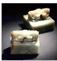
御凤麟洲 水净沙明翡翠组玺。