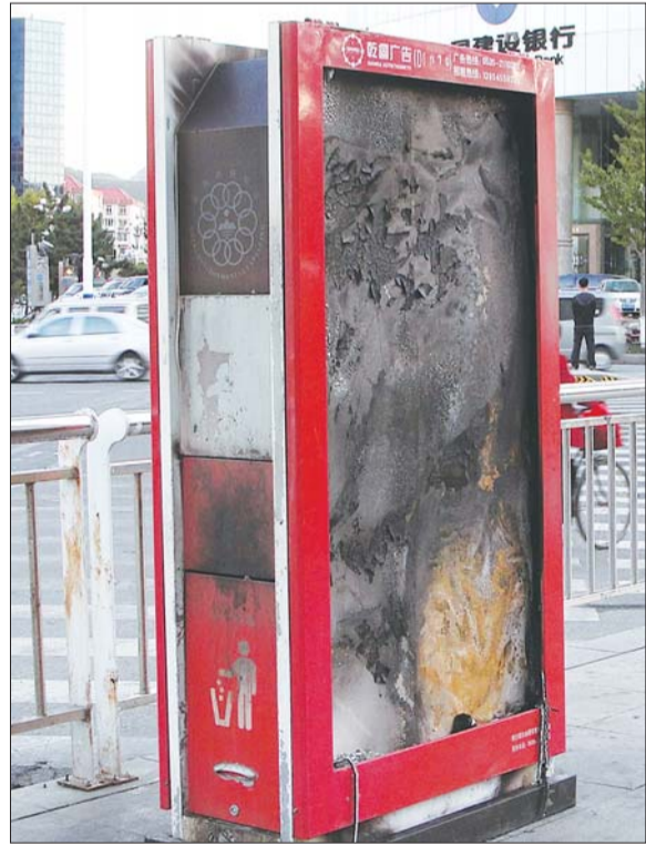
垃圾箱被浓烟熏得面目全非。

漆漆的一片。附近一家银行的保安孙先生称,中午12点半左右,垃圾箱开始冒出黑烟,黑烟从垃圾箱两侧的投入口处向外冒,很快,黑烟就将整个垃圾箱包围住了。“在马路对面根本就看不到垃圾箱,只看到滚滚黑烟。”孙先生说,路过的人都怀疑垃圾箱冒烟是由没熄灭的烟头引起的。“这个季节比较干,风还大,幸好消防人员及时赶到将浓烟熄灭。”