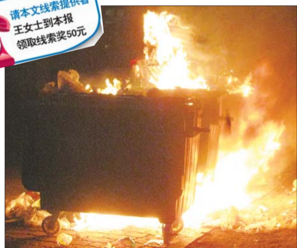
垃圾箱被引燃后,火势不小。

淌着灭火后的废水。绿色的敞口垃圾箱已经被熏黑,里面的垃圾烧掉了不少。在一个垃圾箱上面,还堆放着一些燃放后的烟花纸筒,不少纸筒背面已经烧黑。“别看是两个垃圾箱着火,当时火苗还不小。”市民李先生告诉记者,火灾持续了大概10多分钟。幸好消防官兵及时赶到,消防水枪对着垃圾箱一阵扫射,才阻止了火势继续蔓延。至于起火原因,现场灭火的消防人员猜测说,可能是有人把未完全燃尽的烟花放到了垃圾箱内,在风势下引起了火灾。据了解,事故并没有人员受伤。