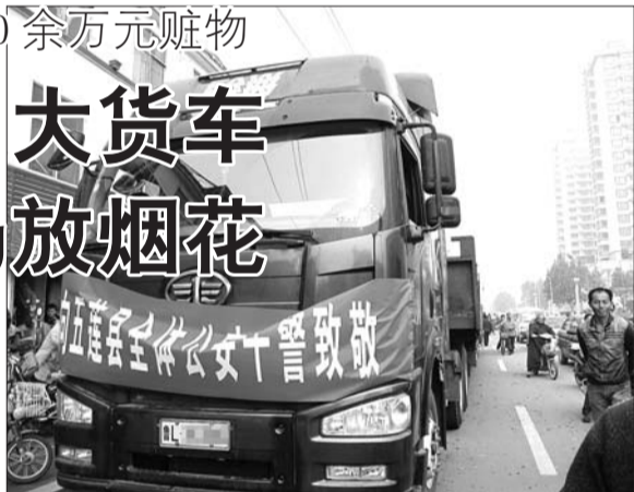
失主在车上打出横幅感谢民警。

本报10月28日讯(记者 徐艳) 27日上午9点30分,五莲县公安局举行集中退赃大会,将今年破获的各类刑事案件追回的赃款、赃物一并退还给了失主,为失主挽回经济损失300余万元。现场一位领回大货车的失主,高兴地放起了烟花。