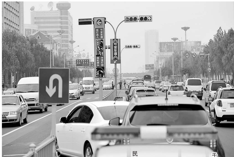
▲10月29日,济南经十路一处路口设立了可变车道,图为车辆在路口掉头、左转。