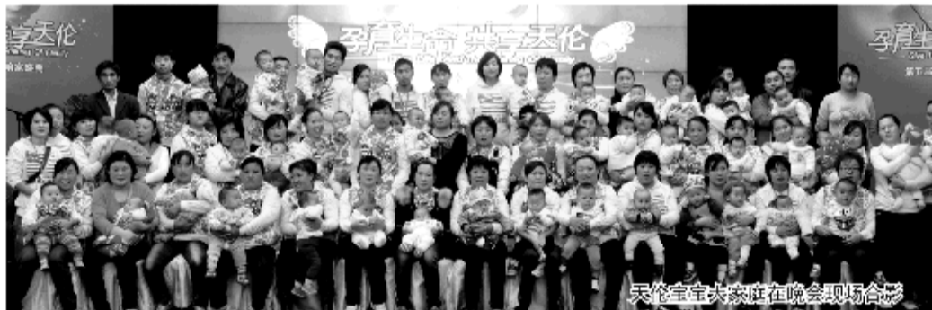
天伦宝宝大家庭在晚会现场合影

更不是一段辛酸的经历。活动现场见到宝宝的准爸爸,这些幸福的爸爸、妈妈们已经无法用语言来表达对家人的感激,他们纷纷送上锦旗、鲜花,感谢给宝宝带来最为珍贵的礼物——孩子,让他们的生活充满了奔头。一百多个天伦宝宝家庭的幸福时刻,感人的幸福时刻。