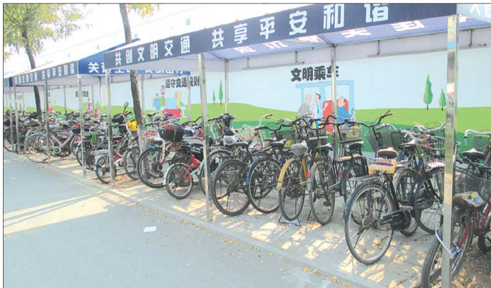
许多在黄岗站换乘巴士的市民,都把车辆停放在便民车棚内。

本报10月29日讯(见习记者 申慧凯) 近日,市民吴先生打电话向本报反映,说自己停在黄岗路口便民车棚内的电动车电池被偷了,希望有关部门加强车棚管理,最好设置专门的人员进行看管。然而有的市民却不同意:“有人看管岂不是变成收费的了。”