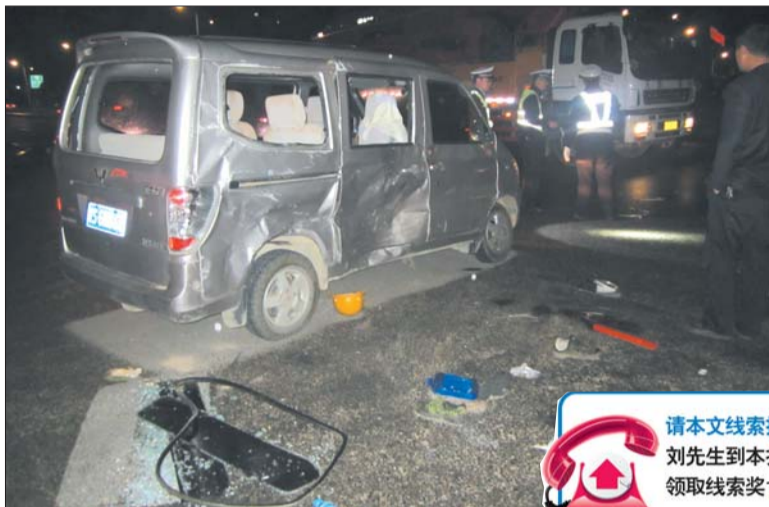
面包车被撞变形,车玻璃和车上物品散落一地。