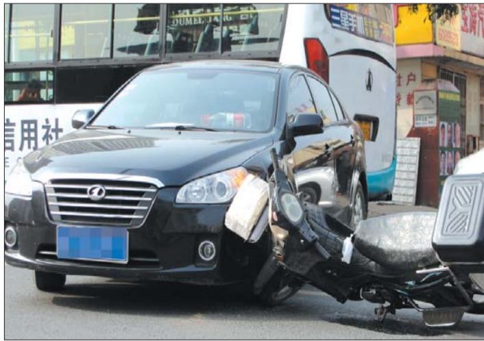
想转弯的奔腾轿车与一辆摩托车在黄实线上相撞。记者 蒋慧晨 摄