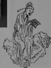
徐干字伟长, 北海郡人, 东汉末年著名学者、哲学家、文学家。著有《中论》。