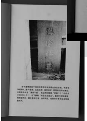
徐干字伟长, 北海郡人, 东汉末年著名学者、哲学家、文学家。著有《中论》。