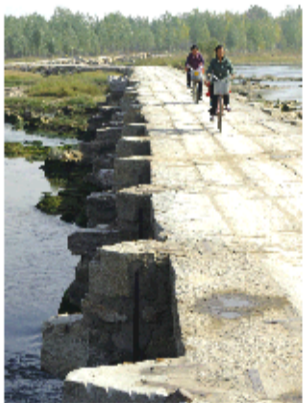
明石碾见证大汶口发展历程。

展历史的一个重要标志，是当时唯一一座横贯大汶河的石碾。如今，明石碾河紧护高铁一河横跨大汶河，成为承载大汶口文化、推动大汶口经济繁荣的大动脉。