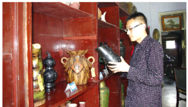
大汶口黑陶馆她来她受欢迎。

大汶口镇工作人员表示，陶文化作为大汶口文化不可或缺的一部分，越来越受到人们的重视和欢迎。在刚刚结束的第四届山东省文化产业博览会上，大汶口陶器作为重要的文化和旅游产品，得到了参会人员的交口称赞。