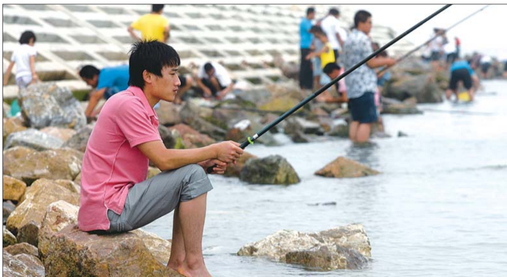
▲在潍坊滨海区的观光大堤旁,人们悠闲地垂钓。

潍坊有海吗?这曾让拥有140公里海岸线的潍坊人很无奈。因为在潍坊的陆海之间,横亘着2600平方公里的盐碱地,靠海真的难见海。但如今,在潍坊滨海经济技术开发区,20公里长的观光大堤犹如一条长龙直插深海,金沙闪烁的海水浴场更是圆了潍坊人多年来的亲海梦。