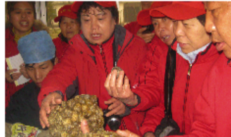
2010年12月1日,济南代表80名参观工厂。