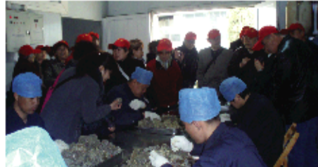
2011年8月14日,济南代表99名参观工厂。