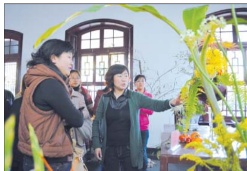
菊展期间,趵突泉公园举行了插花比赛,数十件优秀作品获奖并由专业人员进行了点评。