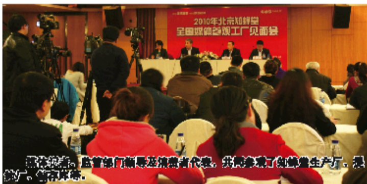
监管部门聘请消费者代表,共同参观了知蜂堂生产厂,现场查看蜂胶原料。

据中国蜂产品协会统计,我国全年产蜂胶原料800吨左右,而市场上销售量却高达1000吨,据说是由制出的树脂冒充蜂胶,以假乱真! 大部分蜂胶企业没有原料提纯处理厂,而是委托药厂加工,根本无法去除蜂胶中的糖、果糖、重金属,无法保障蜂胶中800多种有效成分。 蜂胶原料被剥皮素、芦丁,人为提高维生素含量;添加其它物质,宣称降糖降脂,以此增价,误导消费者。