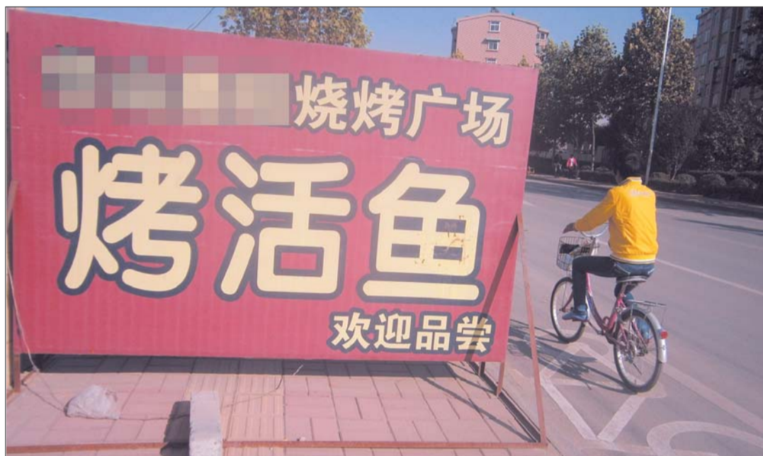
祝舜路上一家烤鱼店的广告牌将人行道堵得严严实实。

附近的另一位居民李女士说,现在孩子上下学都得接送,赶上早晚车流高峰时,行人和车辆抢着走机动车道,很容易发生交通事故。“店家摆广告牌可以理解,但放在店门口就行了,不该妨碍行人。”李女士说。