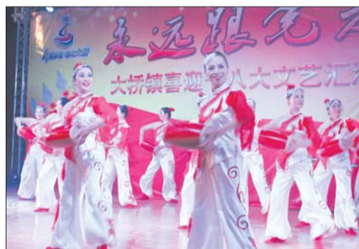
10月31日下午,天桥区大桥镇政府礼堂内,《永远跟党走——大桥镇喜迎十八大文艺汇演》拉开帷幕。该镇的农民歌手、舞蹈队等“草根艺术家”纷纷上台,与专业演员一起倾情献艺。