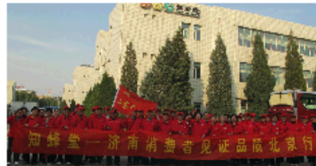
2011年10月28日,济南代表89名参观工厂。

知蜂堂 ZHI FENG TANG 北京知蜂堂咨询服务电话: 0531-86990622